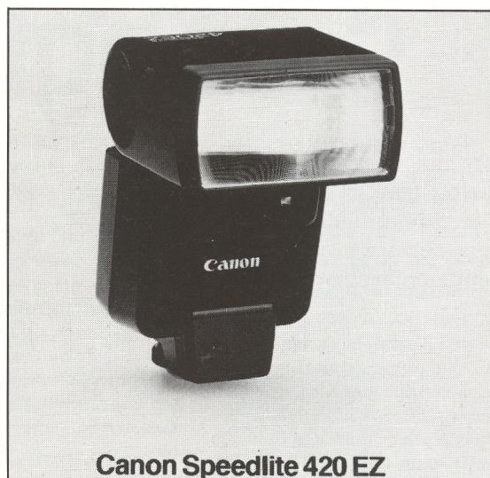
Canon Speedlite 420 EZ

Her kommer det nye Olympus ZOOMline ind i billedet med hurtigt motorskift mellem netop de to brændvidder, der er brug for i et bekvemt, kompakt og automatisk familiekamera: fra en 36 mm moderat vidvinkel til en 60 mm tele, fra gruppe til portræt. Hele processen består blot i at skyde afbryder kontakten fra afbrudt op til vidvinkel og videre til telestilling – klik – klik – zoom... og søgerbilledet følger naturligvis med i denne motorindstilling, så man kan se billedvirkningen. Den lange telebrændvidde kræver en præcis skarphedsindstilling, og det tager ZOOMline højde for med den meget nøjagtige 15-punkt autofocus-indstilling.